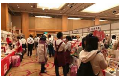
11/14（水）食品展示会参加