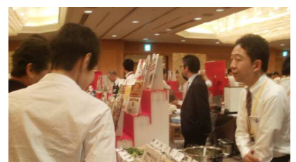
11/27（火）新食品展示会参加