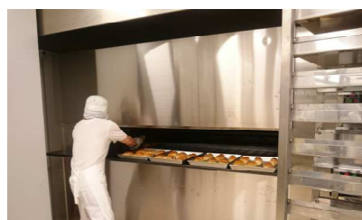
11/26（月）向河原製パン視察