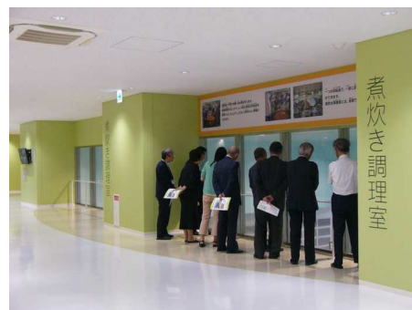
評議員会に先立ち、南部学校給食センターの見学会を行いました。