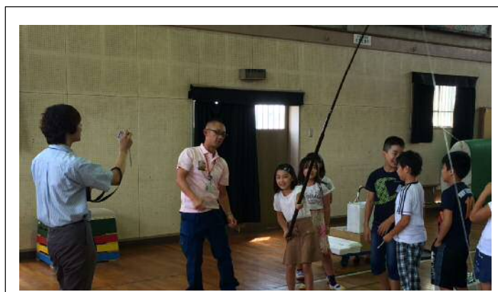
＜カツオの一本釣り体験＞

カツオ役の子が釣り針の部分をしっかり持った状態で、竿を持った子が引き上げると、竿は大きくしなります。そのしなりが戻ろうとする力を使ってカツオを釣り上げ、後ろに跳ね飛ばすのだということを実感していました。