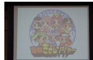
↑：愛南ぎょレンジャー