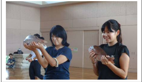
↑：どっちがどっち？分かるかな？

子どもたちの考えの深さに脱帽。この先、スーパーマーケット等で買い物を行った時、鮮魚売り場で「天然もの？養殖もの？愛媛県の真鯛？」などと考えながら魚を眺めるのかなと想像しました。