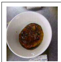
↑：ハンバーグ和風ソース