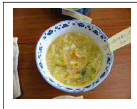
↑：高野豆腐の中華スープ