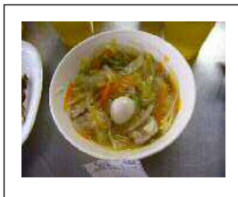
↑：太平燕（タイピーエン）