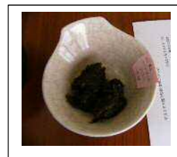
↓：めかじきのにらソース