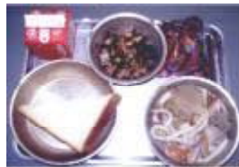
10月18日(金) 617キロカロリー 2分の1はちみつ食パン、牛乳、しっぽううどん、五目豆、シューチーズ