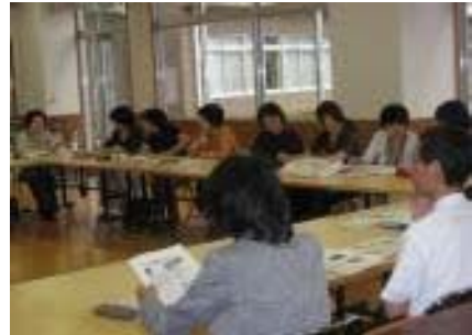
給食主任と栄養職員会(8月) (麻生区)