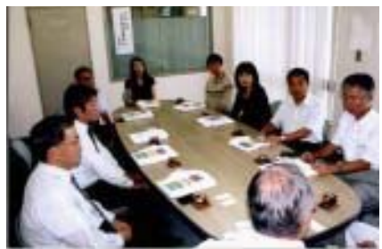
工場視察(8月) ロッテ冷菓株式会社