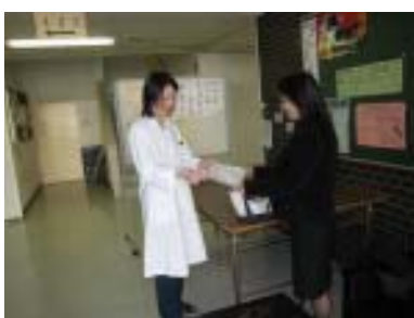
検査用物資確かに受け取りました(衛生研究所にて)