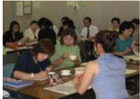
献立決定委員会の様子