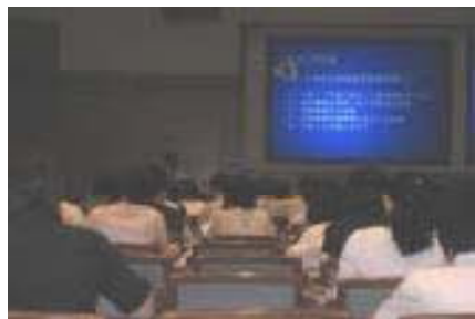
中央講習会の様子(8月) 食に関する指導・学校給食の管理