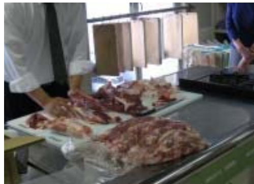
豚肉に関する研修会(協力・大協食品、ムサシノミート)