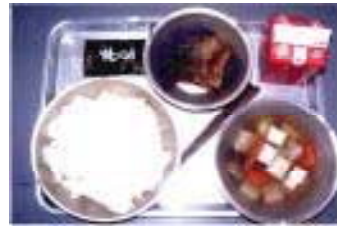
10月23日(火) 684キロカロリー ごはん、焼きのり、牛乳、さばのカレー揚げ、けんちん汁