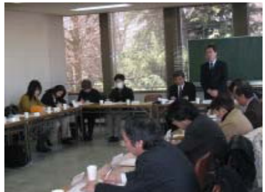
飯塚専務理事(健康教育課長) 学校給食費未納対策マニュアルについての説明