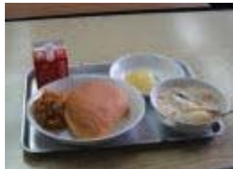
10月29日(月) 716キロカロリー ツナサンド、牛乳、クリームシチュー、ラ・フランス