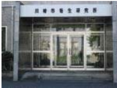
衛生研究所出入り口(鉄筋3階建て)