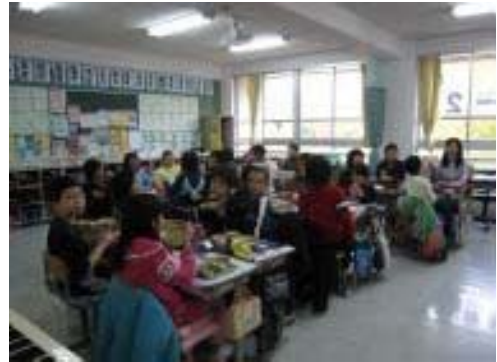
児童数約230名 いただきま〜す 4年生

自然豊かな環境の中でたくさんの野菜や果物が収穫できていました。それを給食に利用していました。こういうことができるのも「おいしい給食を」という合言葉のもとで教職員全員がそれぞれの立場で出来ることをする。そういう日々の取組の結果が受賞につながり、うれしさいっぱい、おどろきいっぱい、感謝でいっぱいの気持ちです。小規模校のメリットと自然豊かな学校環境を教育活動に生かしていることが本校の特色でしょうか。