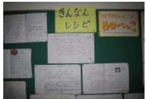
ぎんなんレシピ パザーでも売りだす