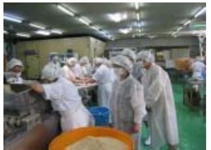
工場現地視察(8月) 株式会社 海渡