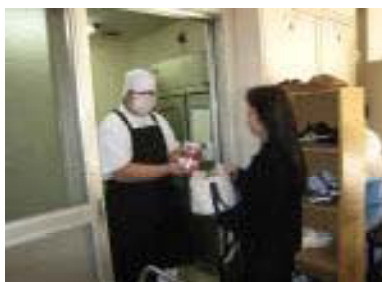
検査用物資の受け取り(宮前小にて)