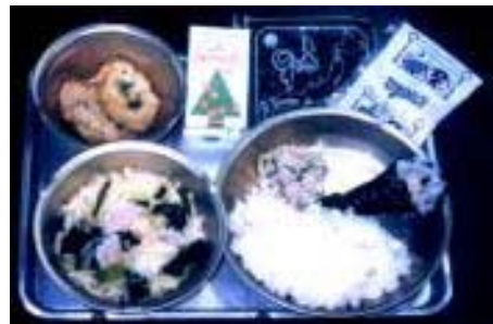
ある日の給食メニュー